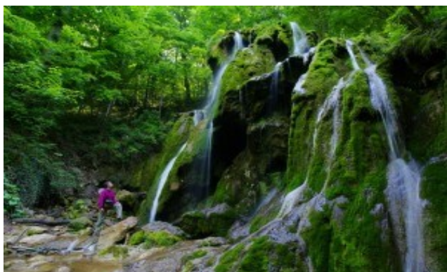
Vodopád Cascada Beusnitei v Muntii Locvei, Rumunsko

Na počátku cestoval Rumunskem sám, pak s přáteli. Nakonec se seznámil s těmi nejlepšími partnery na cesty do rumunských hor – s vlastními Rumuny. Domorodci jsou mu nejlepší průvodci v tamních horách, neboť jsou tam doma. Od nich se naučil poznávat krásy Karpat novými očima.