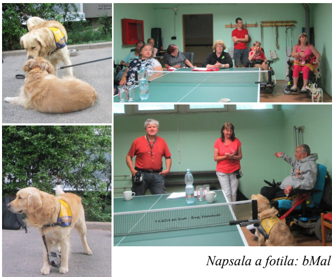
Napsala a fotila: bMal

Děkujeme přednášejícím za zajímavé povídání, odpovědi na různé dotazy, poskytnuté rady a nejednu ukázkou s „problémovými“ pejsky, kteří v jejich přítomnosti nebyli problémoví. Těšíme se, že při dalším setkání se rozšíří počet „pejskařů“, kteří projeví zájem o vylepšení komunikace se svým domácím mazlíčkem.