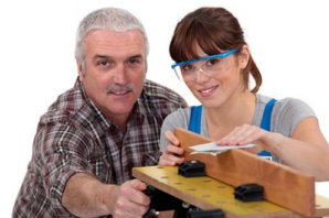
Podpora při rekvalifikaci

Rekvalifikace může být často jediným východiskem pro lidi, kteří nemohou najít uplatnění ve svém oboru. Nabídka rekvalifikačních kurzů je přitom velmi pestrá – od administrativní práci s počítačem, přes účetnictví, automechanika či maséra. Rekvalifikační kurz lze dnes najít téměř na jakoukoliv profesi. Cena kurzu se nejčastěji pohybuje od 5.000,- Kč až do 30.000,- Kč. Proto je vhodné využít státní podpory.